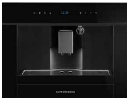
KCM 182 Black