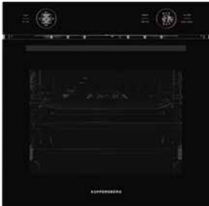
HT 612 Black