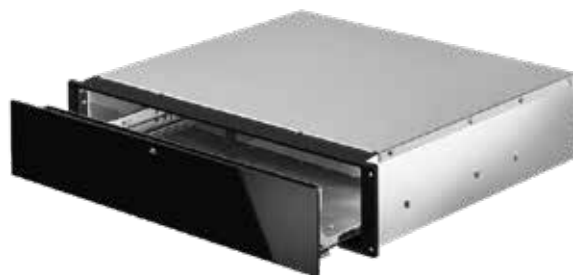
KWD 600 Black