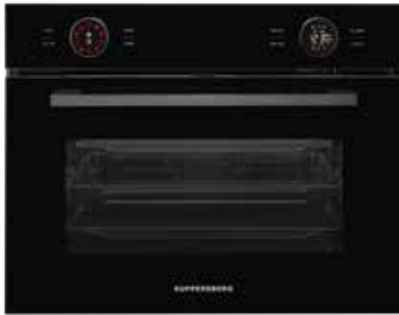
KMW 612 Black