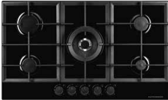
FG 95 B