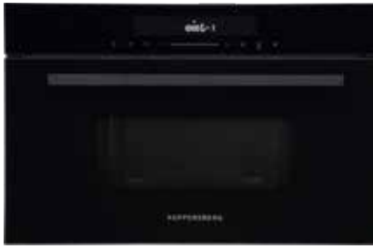
HMW 634 Black