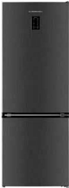
NRV 192 X