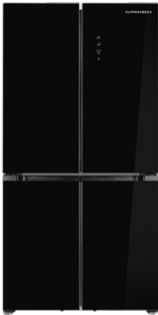
NFFD 183 BKG