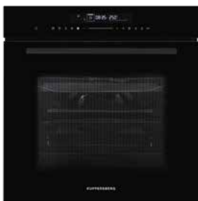
HK 616 Black